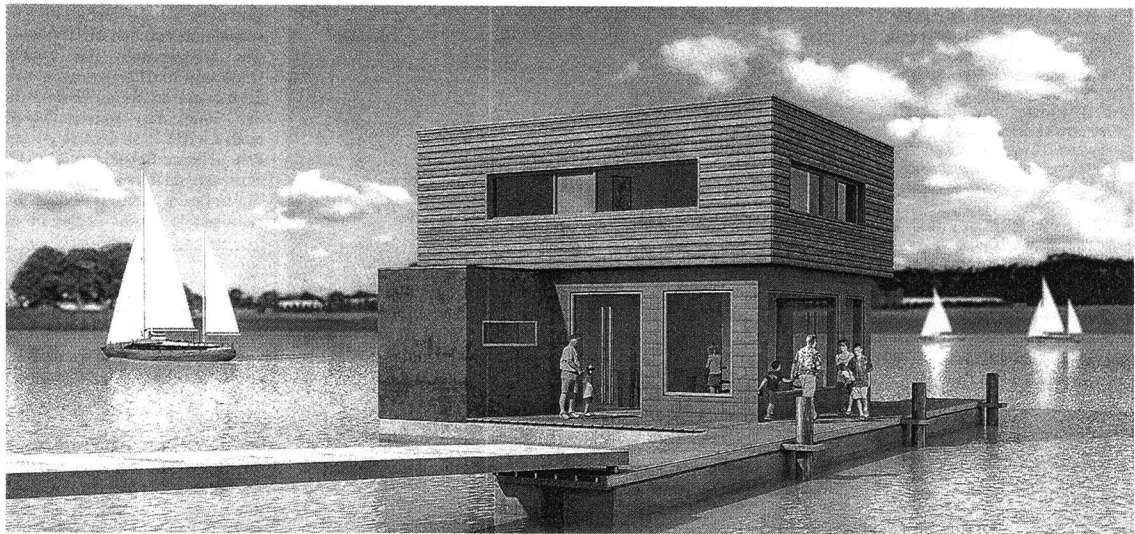
So sieht die zweistöckige Tauchschule auf Pontons aus, wenn sie komplett fertiggestellt ist

Neue Attraktion auf dem Gräbendorfer See soll Touristen in die Lausitz locken